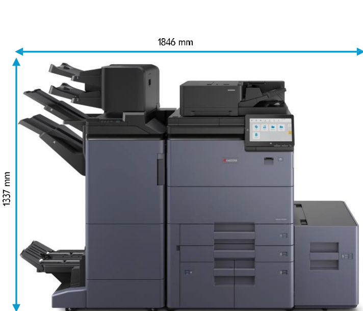
DF-7200/7210 PF-7200 IS-7200 BF-7200