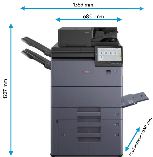
Copy Tray (D)