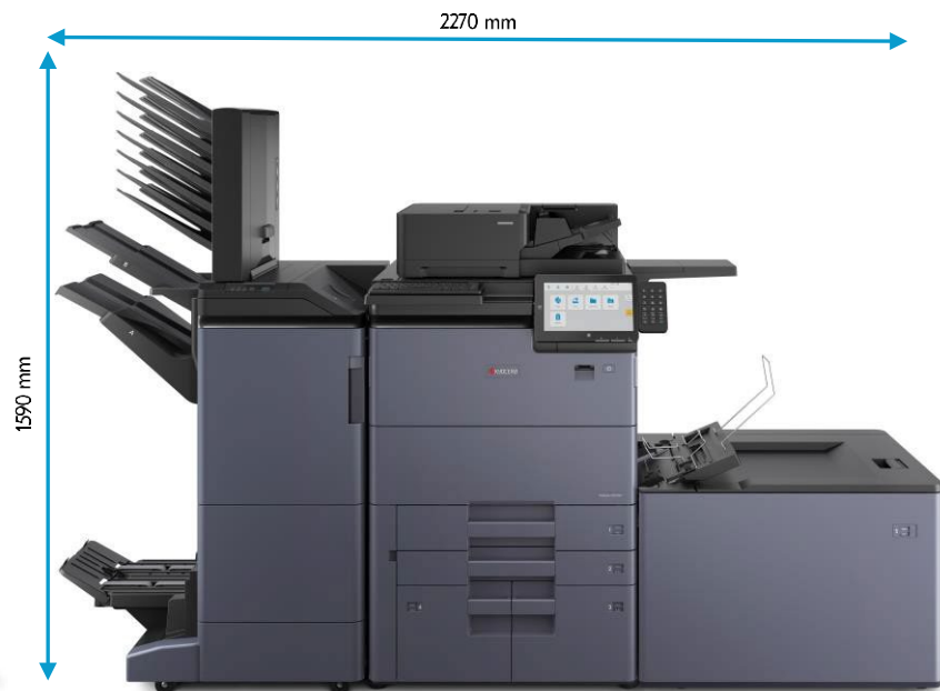
DF-7200/7210 PF-7210 BF-7200 MT-7200