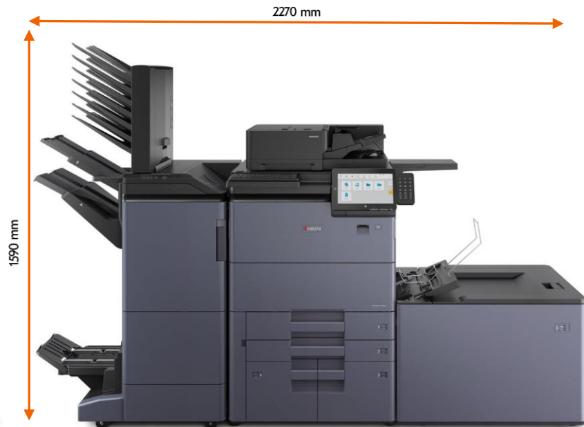
DF-7200/7210 PF-7210 BF-7200 MT-7200