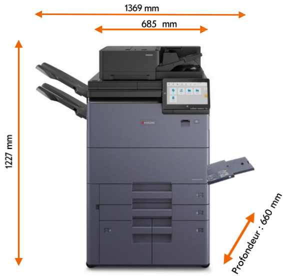
Copy Tray (D)