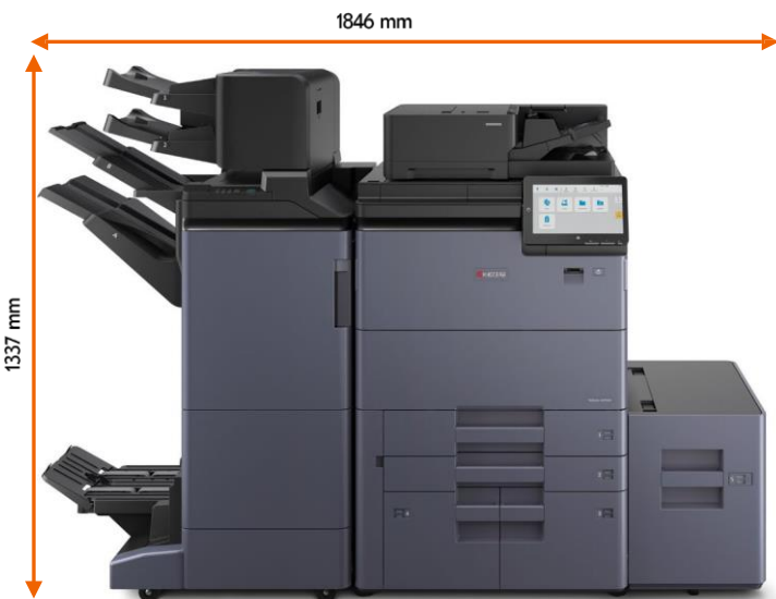
DF-7200/7210 PF-7200 IS-7200 BF-7200