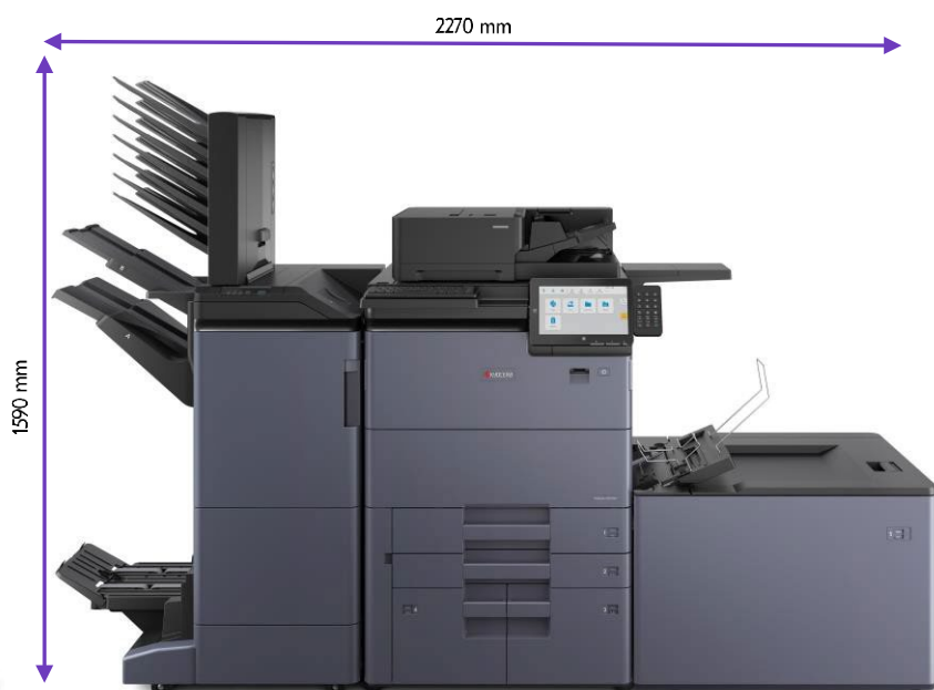
DF-7200/7210 PF-7200 BF-7200 MT-7200