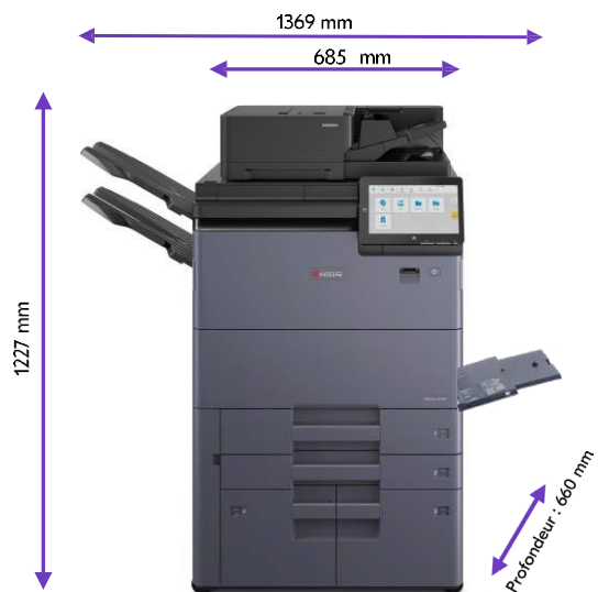
Copy Tray (D)