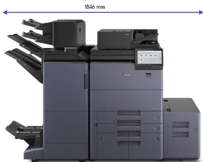
DF-7200/7210 PF-7200 IS-7200 BF-7200